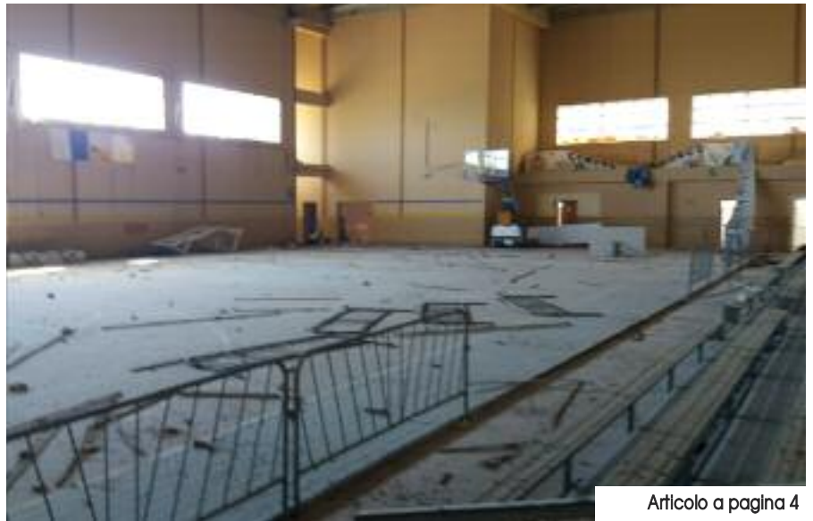
Articolo a pagina 4