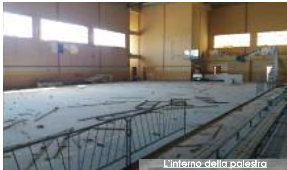
L'interno della palestra