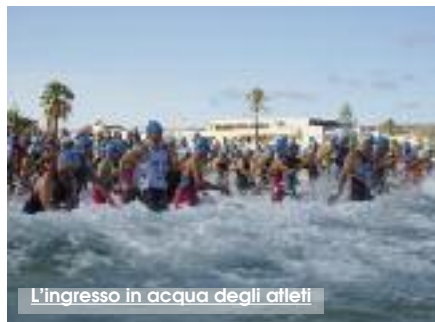
L'ingresso in acqua degli atleti