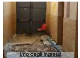
Uno degli ingressi

Pietro Daidone, in data 20 giugno 2013, a seguito dei lavori di messa in sicurezza della trave della palestra Comunale, trasmetteva al Comune di Paceco due copie del certificato