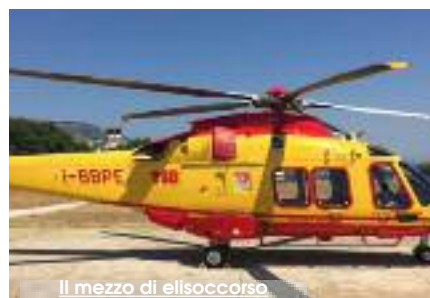
Il mezzo di elisoccorso

L'ASP di Trapani ha indetto la gara d'appalto per il completamento dei lavori per l'elipista dell'ospedale Sant'Antonio Abate. L'ammontare complessivo è di oltre 600 mila euro. L'azienda aggiudicataria avrà 180 giorni per completare i lavori. Si tratta di un'opera il cui iter era stato avviato nel 2005, ma solo lo scorso aprile era stato emanato il decreto dell'assessorato regionale Territorio e ambiente che autorizzava l'esecuzione del progetto. L'elipista, che si trova alle spalle della struttura sanitaria, potrà essere utilizzata sia per voli diurni che notturni. Questo consentirà l'abbattimento dei tempi di trasferimento dei pazienti. Finora l'elisoccorso del 118 ha utilizzato l'elisuperficie di Valderice, in contrada Seggio, distante circa 10 Km, oltre a una superficie alternativa per il volo notturno, idonea all'atterraggio dei velivoli HEMS (emergenza medica) all'aeroporto di Trapani Birgi. L'elipista occuperà un'area di 5.700 mq, attualmente libera dietro l'ospedale,