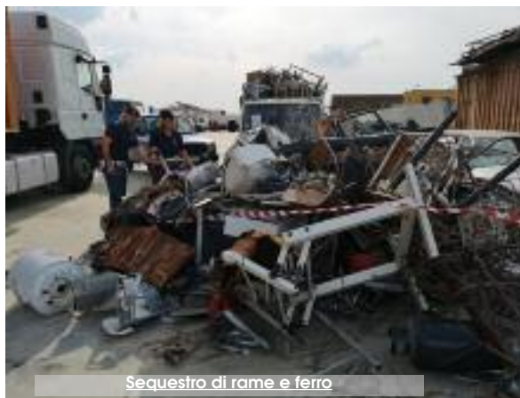
Sequestro di rame e ferro